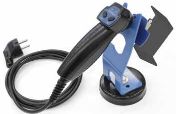
Spiegelschweißgerät EErgo mit Z-Spiegel

Kompakte Führungseinheit für Überlappverschweißungen mittels Z-Spiegel mit radialem und axialem Anpressdruck.