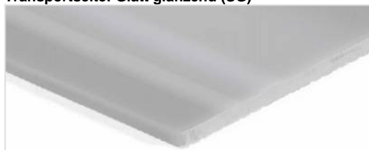
Transportseite: Glatt glänzend (SG)