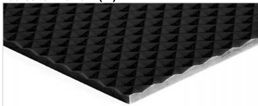
Laufseite: Diamant (ID)