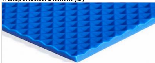
Transportseite: Diamant (ID)