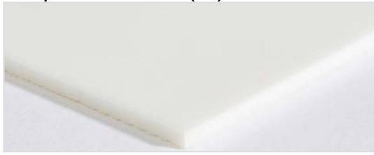
Transportseite: Glatt matt (SM)