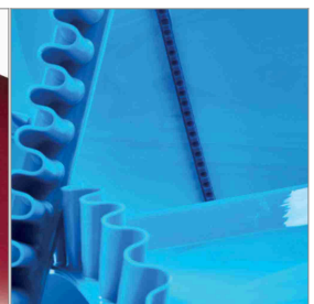
Bandzubehör aus PU