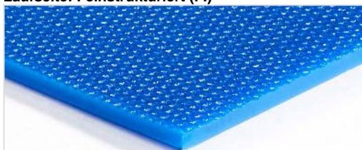
Laufseite: Feinstrukturiert (FI)