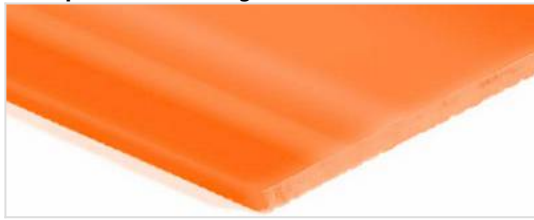
Transportseite: Glatt glänzend (SG)