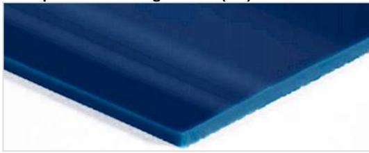
Transportseite: Glatt glänzend (SG)