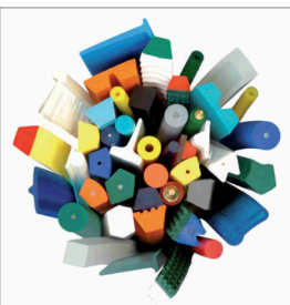
Zgrzewalne paski z PU i TPE