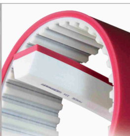
Powłoki PU do pasków rozrządu i klinowych