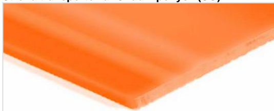
Strona transportowa: G?adki po?ysk (SG)