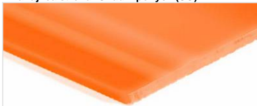
Dzia?aj?ca strona: G?adki po?ysk (SG)