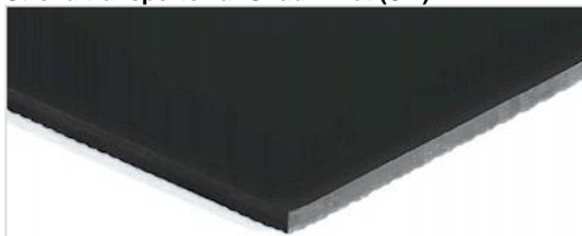
Strona transportowa: Gładki mat (SM)