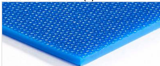
Laufseite: Feinstrukturiert (FI)