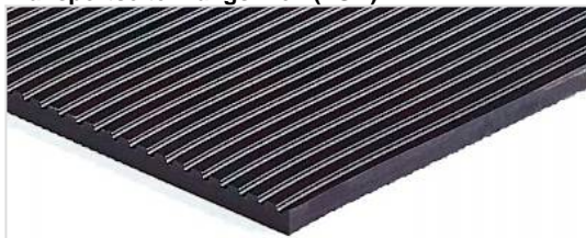
Transportseite: Längsrillen (LGB)