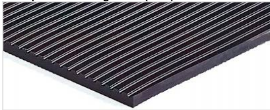
Transportseite: Längsrillen (LGB)