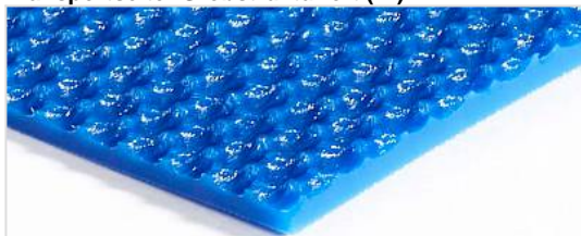
Transportseite: Grobstrukturiert (RI)