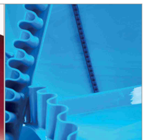
Bandzubehör aus PU