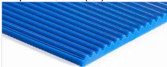
Transportseite: Querrillen (TGA)