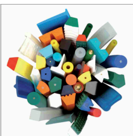
Profili a nastro saldabili in PU e TPE