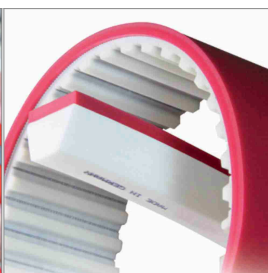
Rivestimenti in PU per cinghie dentate e trapezoidali