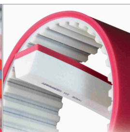
Rivestimenti in PU per cinghie dentate e trapezoidali