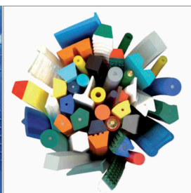
Profili a nastro saldabili in PU e TPE