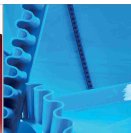
Accessori per nastri trasportatori in PU