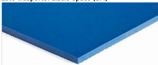
Lato trasporto: Liscio opaco (SM)