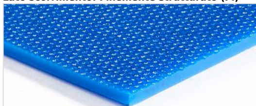
Lato scorrimento: Finemente strutturato (FI)