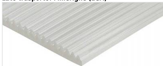
Lato trasporto: Millerighe (LGA)