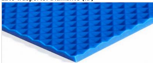
Lato trasporto: Diamante (ID)