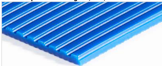
Lato trasporto: Millerighe (LGB)