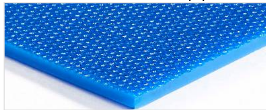
Laufseite: Finemente strutturato (FI)