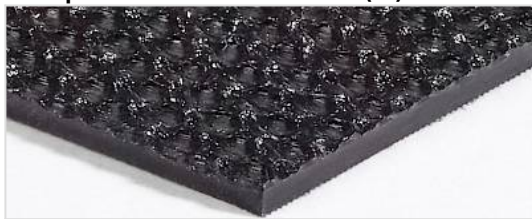
Transportseite: Grobstrukturiert (RI)