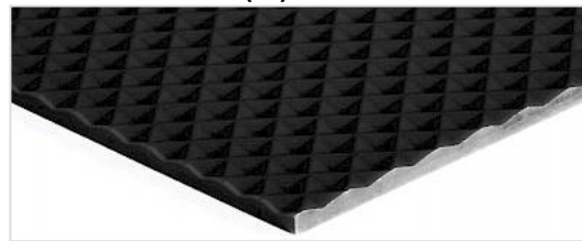
Laufseite: Diamant (ID)