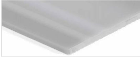
Côté de transport: Lisse brillant (SG)