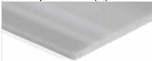
Côté de transport: Lisse brillant (SG)