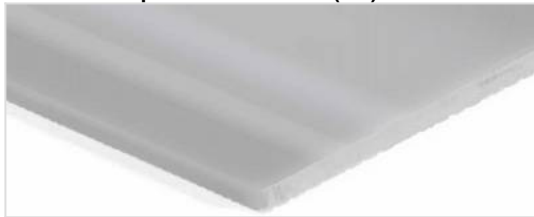
Côté de transport: Lisse brillant (SG)