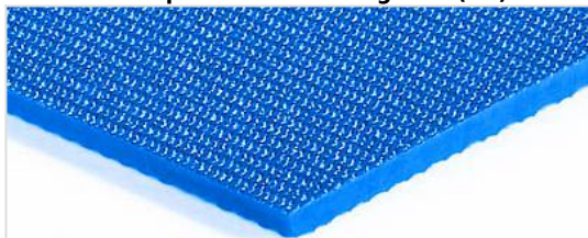
Côté de transport: Finement rugueux (SR)