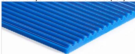
Côté de transport: Rainures transversales (TGA)