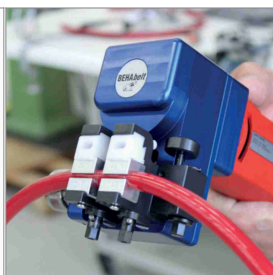
Techniques de soudage et de connexion pour PU et TPE