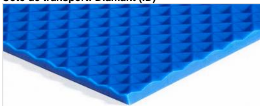
Côté de transport: Diamant (ID)