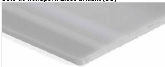
Côté de transport: Lisse brillant (SG)