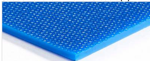
Côté d'entraînement: Finement structuré (FI)