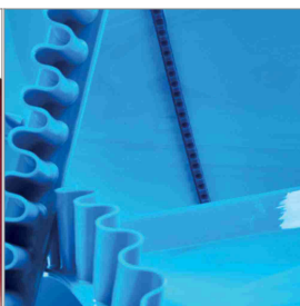
Accessoires de bande en PU