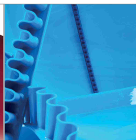
Accessoires de bande en PU