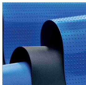
Bandes transporteuses monolithiques en PU et TPE

Solutions de produits complémentaires ainsi que techniques de soudage et de connexion.