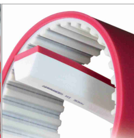
Revêtements en PU pour courroies dentées et trapézoïdales