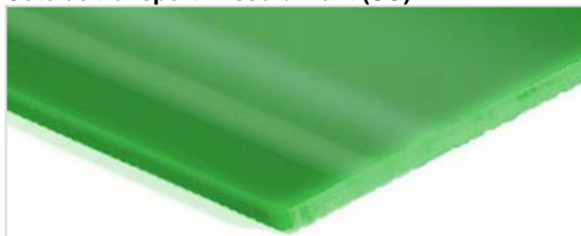
Côté de transport: Lisse brillant (SG)