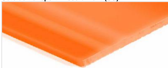
Côté de transport: Lisse brillant (SG)