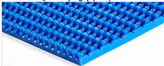
Côté de transport: Supergrip (ESG)