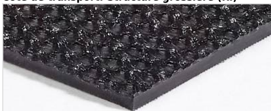
Côté de transport: Structure grossière (RI)