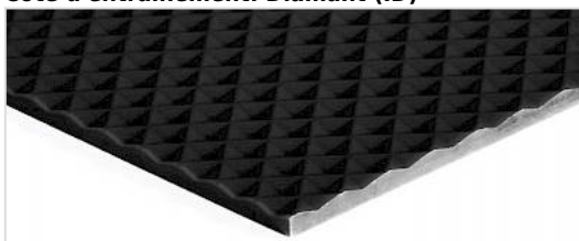
Côté d'entraînement: Diamant (ID)