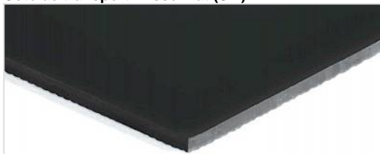
Côté de transport: Lisse mat (SM)