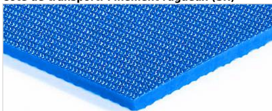
Côté de transport: Finement rugueux (SR)