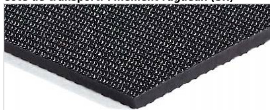
Côté de transport: Finement rugueux (SR)