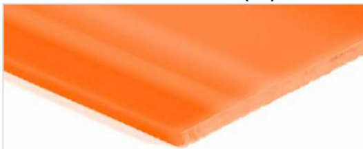
Lado de rodadura: Brillante liso (SG)