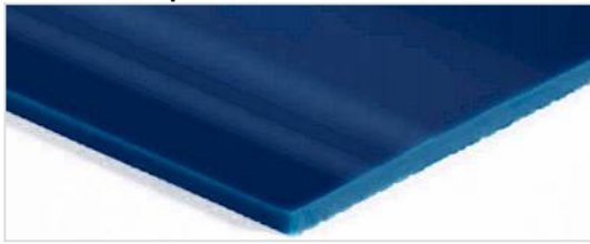
Lado de transporte: Brillante liso (SG)