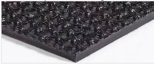
Lado de transporte: Grabado rugoso (RI)