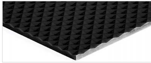
Lado de rodadura: Diamante (ID)